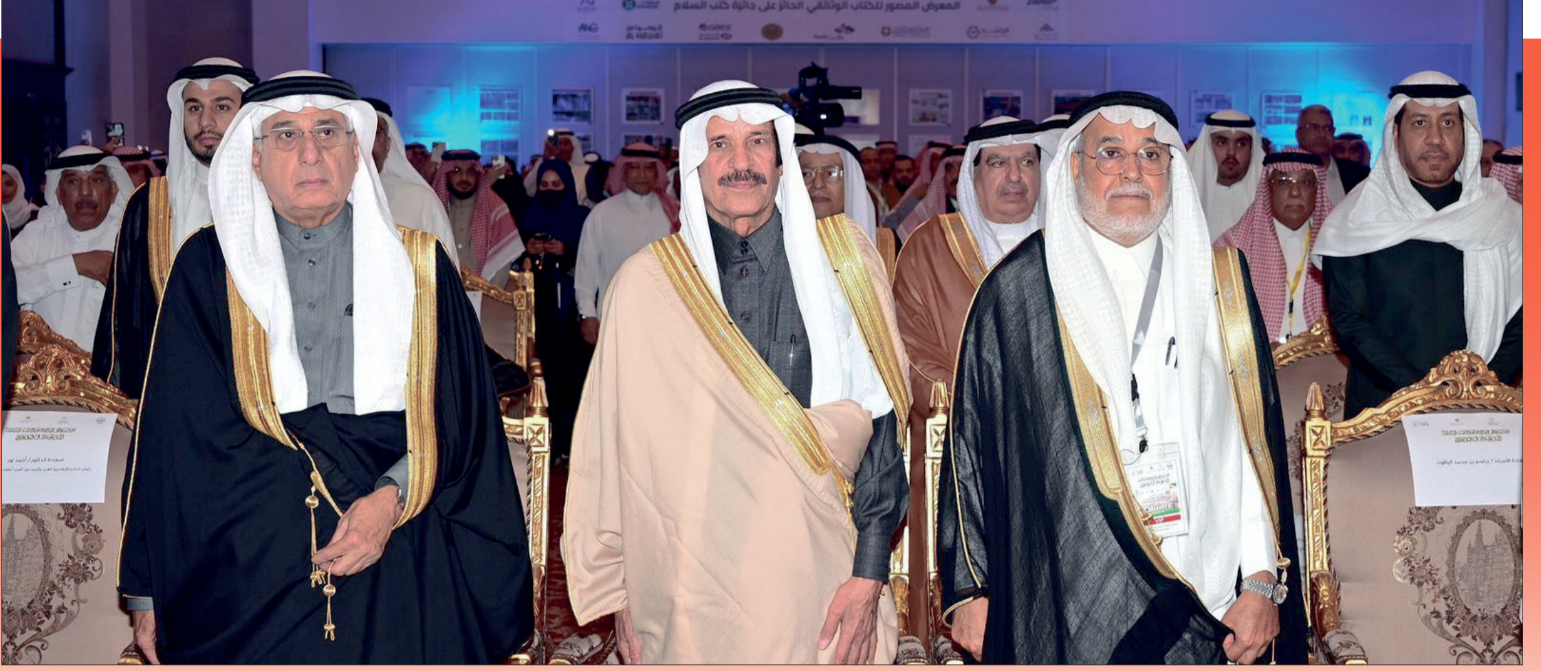
معالي الأستاذ نبيل الحمد وخالد المالك وجاسم باقوت في الحفل