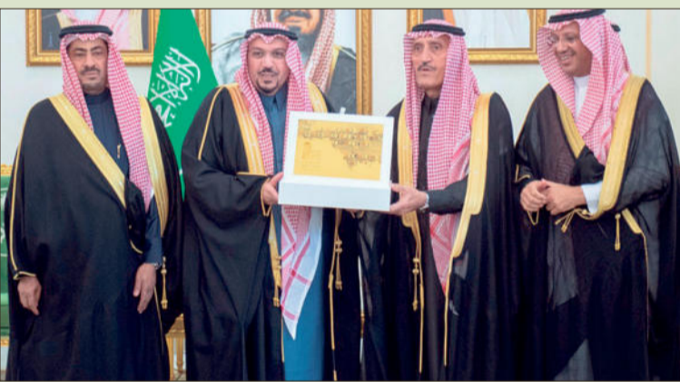
سموه يتسلم التقرير