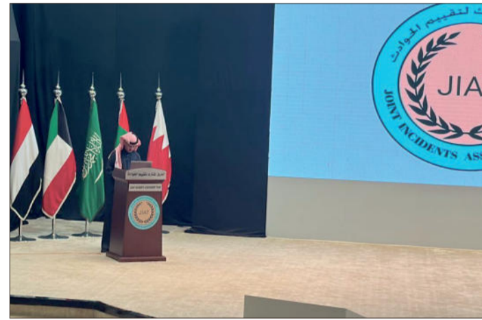
من المؤتمر الصحفي