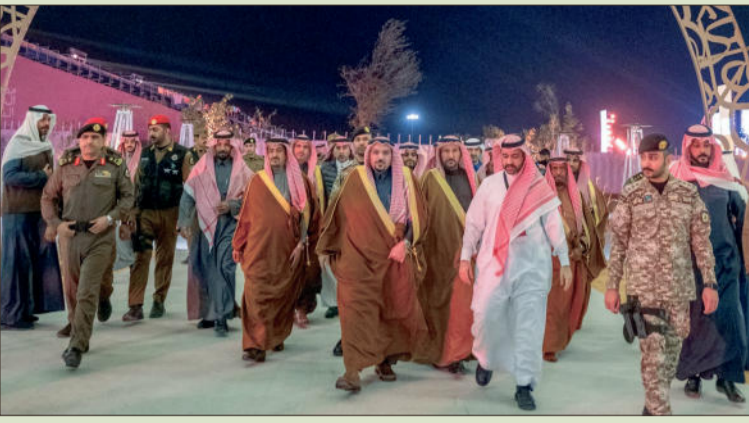
سموه يتجول على الفعاليات