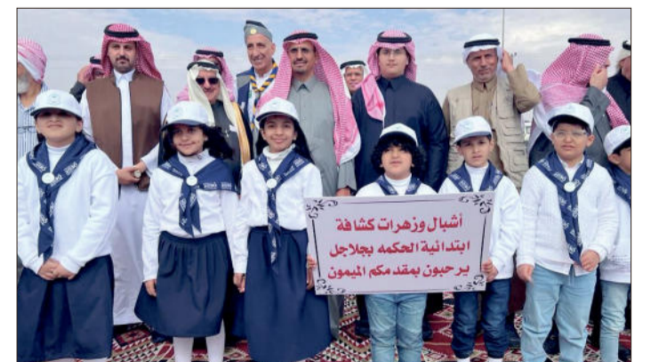
جانب من الحفل

شهد الأمير متعب بن فهد بن فيصل آل سعود مؤسس ورئيس مجلس إدارة جمعية البيئة ومكافحة التصحر ومجلس إدارة جمعية الطقس والمناخ بعد ظهر أول أمس اختتام البرنامج العملي للتأهيل البيئي الذي نفذته جمعية أصدقاء رواد الكشافة في منتزه