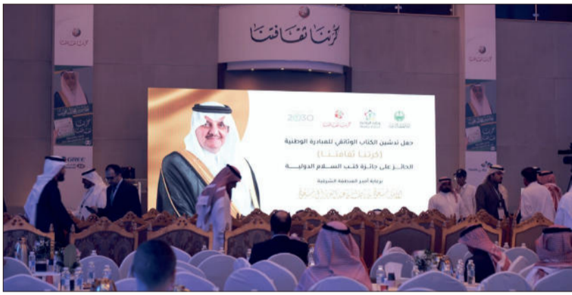
أمير المنطقة الشرقية الأمير سعود بن نايف كانت المناسبة برعايته

الشرقية على رعايته واهتمامه ومتابعته للشأن الرياضي في المنطقة. وأوضح الباقوت أنه تم عرض الكتاب في أكثر من 400 جامعة عربية، وفي المتحف الأولمبي في قطر ومتحف كرة القدم في كازاخستان، ومتحف أمين ساعاتي الرياضي في جدة مما يعزز مكانته ونجاحه العالمي. وتخلل الحفل عدد من العروض المرئية حول مسيرة العمل الرياضي محليًا وخليجيًا وعربيًا ودوليًا، إضافة إلى تكريم عدد من الشخصيات الرياضية وفريق العمل والوسائل الإعلامية.