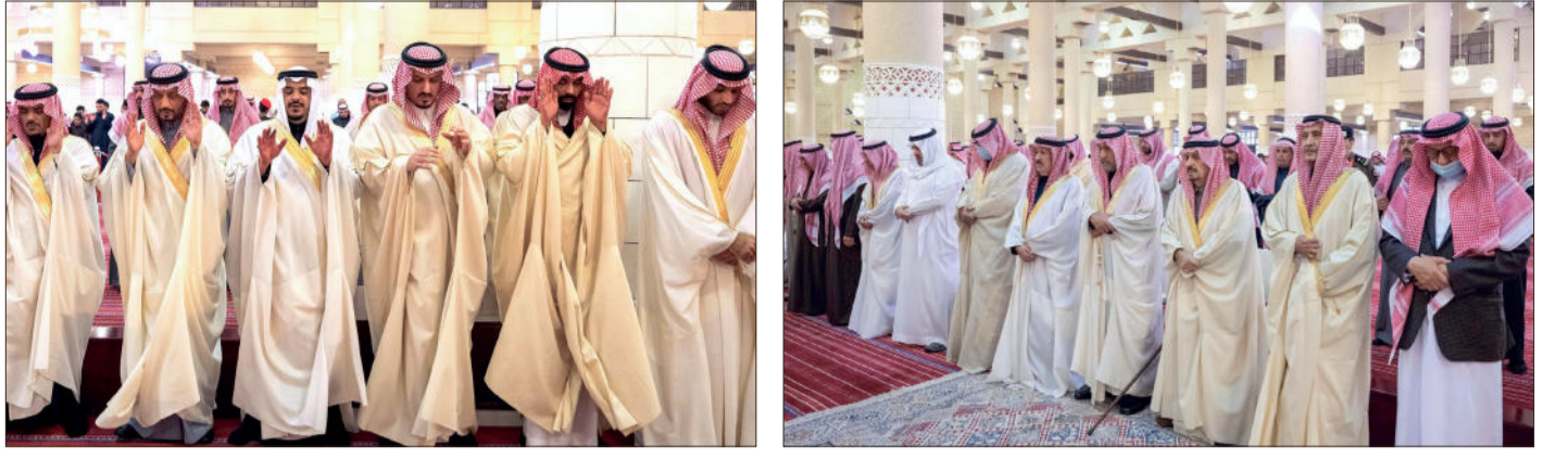
جانب من أداء الصلاة