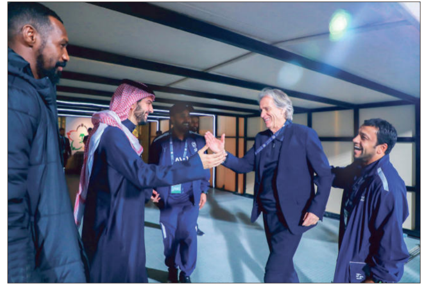
جيسوس سيدرس مع ابن ناقل احتياجات الفريق

وأضاف: بسبب طريقة اللعب لم يكن لاعبونا بنفس سرعتهم في المباريات الماضية، لكن مع التعديلات التي أجريناها وتنوع اللعب تمكنا من التسجيل والفوز، وأشار جيسوس إلى أنه من المهم في مثل هذه المباريات الدفاعية عدم استقبال هدف، لأنك لو استقبلتهدفاً فسيكون التعويض صعباً.