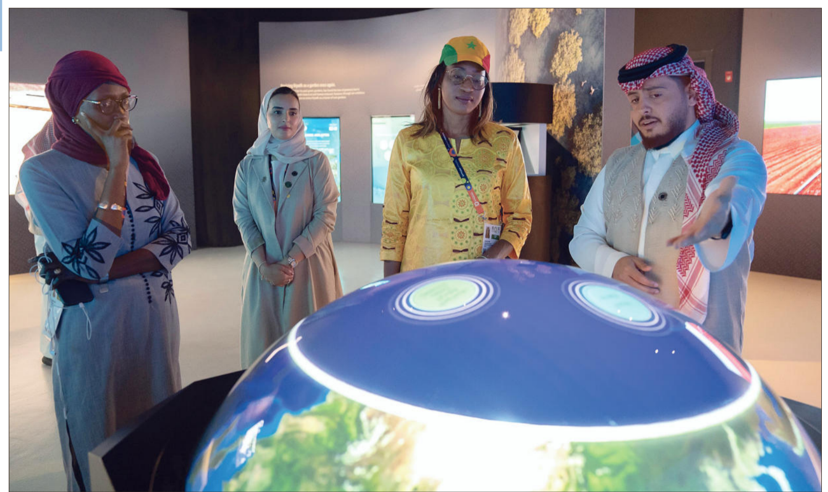
يستقبل جناح المملكة العربية السعودية الأكبر في معرض إكسبو الدوحة 2023م للبيئة، زواره من مختلف دول العالم بسبع لغات، وذلك لتعزيز فرص التواصل والتفاهم الثقافي وتوطيد العلاقات الدولية بين المملكة وشعوب العالم، ويعد الجناح فرصة لجميع الزوار للتعرف على التضاريس الطبيعية في السعودية، وأبرز المبادرات والمشاريع الموجودة على أرض الواقع، ودور رؤية المملكة 2030، في تشكيل المستقبل.