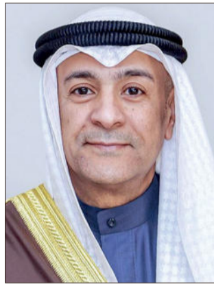
جاسم محمد البديوي

من أجل تعزيز علاقات مجلس التعاون الاقتصادية مع الدول والتكتلات الدولية الأخرى، وتحقيق المصالح التجارية والاستثمارية المشتركة». وأوضح معالي الأمين العام، أن هذا التوقيع أتى كثمرة لمفاوضات استمرت على مدى (5) جولات، عكست الرغبة الحقيقية المشتركة في تعزيز الشراكة الإستراتيجية والتعاون الاقتصادي بين الجانبين، مشيراً إلى أنه من المتوقع أن تسهم هذه الاتفاقية في زيادة حجم التجارة الثنائية وزيادة التبادل التجاري في السلع والخدمات بين الطرفين، وتعزيز خطط التنوع الاقتصادي في دول الخليج وكوريا. وأكد البديوي أن الاتفاقية