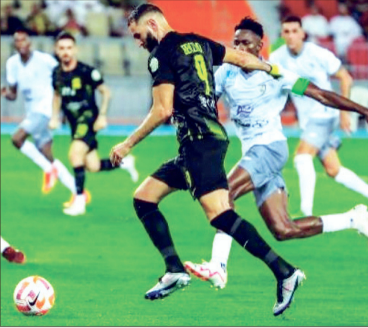
الاتحاد والطائي... تأجلت بسبب ظروف الطيران

حائل «الجزيرة» تم تأجيلها إلى يوم الأربعاء الموافق 7 فبراير 2024م.