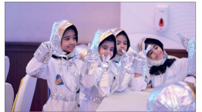
بنات صغيرات ظهرن على بشكل رائدات فضاء ضمن فقرات الحفل