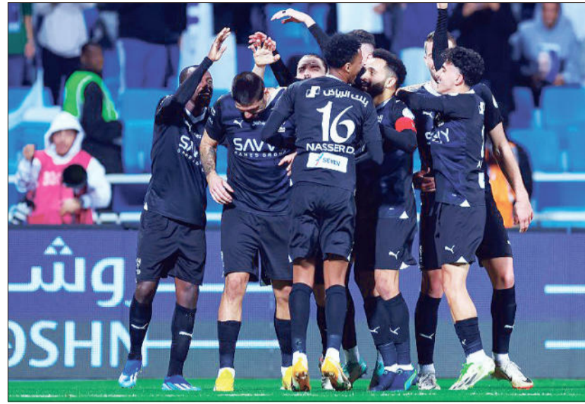
الهلال سجل أرقاماً قياسية كبيرة قبل التوقف